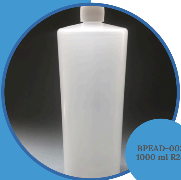
BPEAD-002 1000 ml R24

Botella polietileno alta densidad (BPEAD) 1000 ml R-24