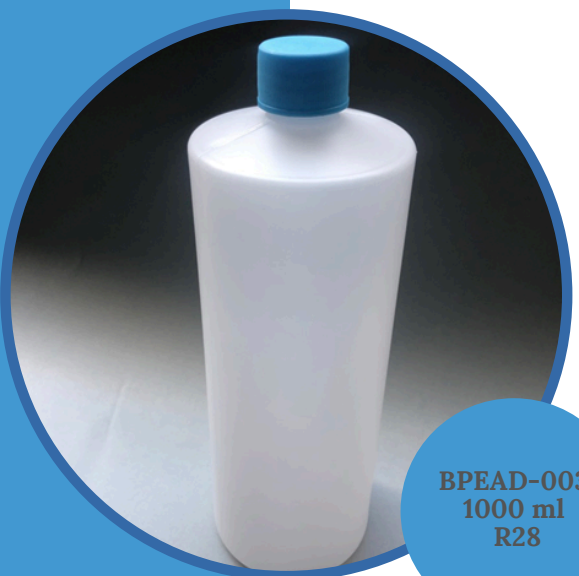
BPEAD-003 1000 ml R28

Botella polietileno alta densidad (BPEAD) 1000 ml R-24