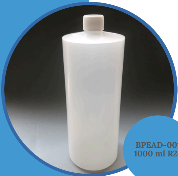
BPEAD-001 1000 ml R24